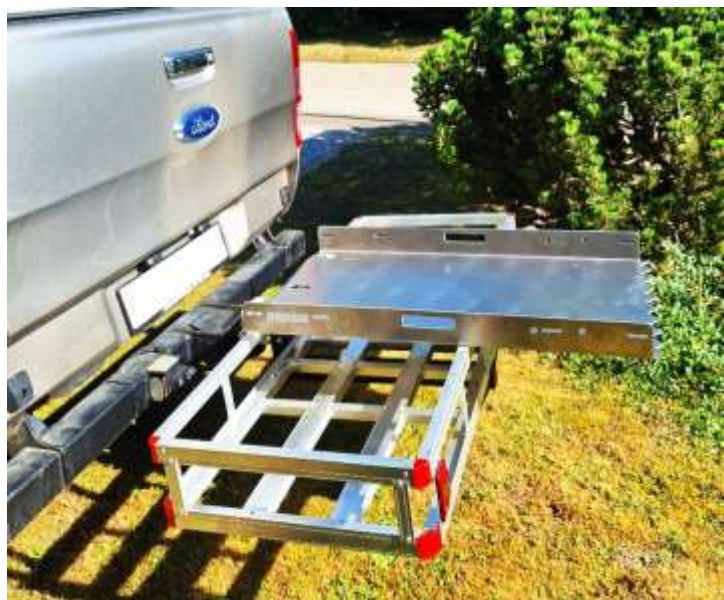
Als Aufbrechtisch für schwaches Schalenwild