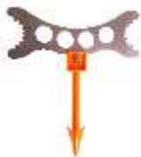
Standard-Kombi-Wildspreizer mit Enddarmzieher (Reh, Gams, Überläufer) Art.-Nr. WS24003

EUR 45.90 zzgl. MWST CHF 47.25 inkl. MWST (CH/FL)