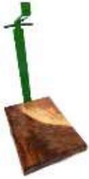
Trophäenständer für Damhirsch und Steinbock mit Holzsockel Art.-Nr. TS24014

EUR 114.90 zzgl. MWST CHF 118.30 inkl. MWST (CH/FL)