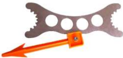
Kombi-Standard-Wildspreizer für Rehwild, Gams, Überläufer