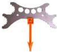
Universal-Kombi-Wildspreizer mit Enddarmzieher (Reh bis Hirsch) Art.-Nr. WS24002

EUR 24.90 zzgl. MWST CHF 25.65 inkl. MWST (CH/FL)