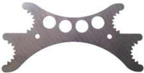
Universal-Wildspreizer für alles Schalenwild

Unser Universal-Wildspreizer für alle Schalenwildarten. Mit 4 Spreizkrallen können Rehwild und schwache Sauen mit der kleinen Spreizkrallendistanz am Brustkorb gespreizt werden. Mittelstarkes Wild wie Überläufer wird mit den Spreizkrallen diagonal eingesetzt und für starkes Schwarz- und Rotwild, werden die Spreizkrallen mit der grossen Distanz verwendet. Mit angebautem, schwenkbarem Ringler, wird er zum Kombi-Universal-Wildspreizer.