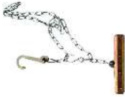
Wildbergkette Typ ‚MOUNTAINS‘ Art.-Nr. WB24001

EUR 119.90 zzgl. MWST CHF 123.50 inkl. MWST (CH/FL)