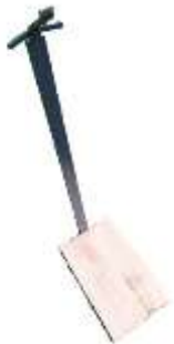
Rothirschtrophäenständer mit Holzsockel Art.-Nr. TS24015

EUR 179.90 zzgl. MWST CHF 185.20 inkl. MWST (CH/FL)