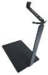
Trophäenständer für Damhirsch und Steinbock Art.-Nr. TS24004

EUR 114.90 zzgl. MWST CHF 118.30 inkl. MWST (CH/FL)