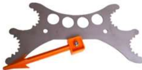
Kombi-Universal-Wildspreizer für alles Schalenwild