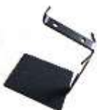
Gams-Trophäenständer Art.-Nr. TS24002

EUR 62.90 zzgl. MWST CHF 64.75 inkl. MWST (CH/FL)