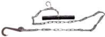
Wildbergkette Typ ‚BATTUE‘ Art.-Nr. WB 24002

EUR 119.90 zzgl. MWST CHF 123.50 inkl. MWST (CH/FL)